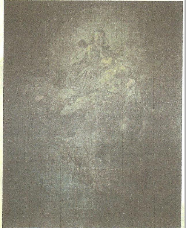
Mattia FRANCESCHINI, Dipinto su tela raffigurante Madonna con Bambino, San Giuseppe e Francesco d'Assisi